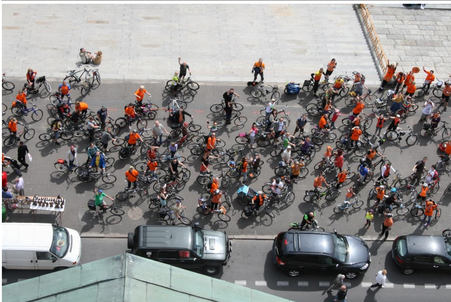
Autor Renata Lis: "Zdjęcie grupowe uczestników Odjazdowego Bibliotekarza zrobione ze 100-letniej wieży Muzeum Narodowego w Szczecinie"

Renata Lis jest otwarta na propozycje oraz na współpracę. Chętnie udostępni wystawy zainteresowanym bibliotekom oraz innym ośrodkom kultury. Można się z nią kontaktować drogą mailową: na poczcie służbową lub poczcie prywatną .